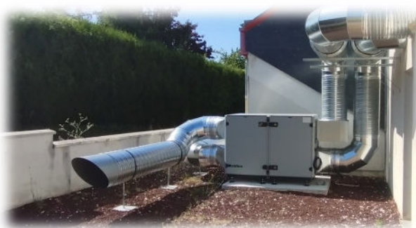
la pompe à chaleur