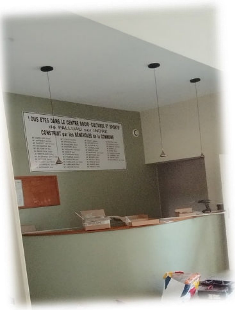
le plafond « abaissé » et les nouveaux luminaires

Centre Socio Culturel : voici quelques photos de l'avancée des travaux.