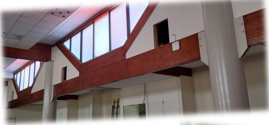
le remplacement des fenêtres